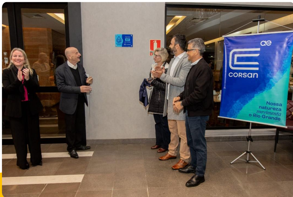
Diretoria da Corsan entrega o Selo ao Dall'Onder Hotel, de Bento Gonçalves.

O Programa reconhece estabelecimentos parceiros pelo uso responsável da água, pela destinação adequada de esgoto e pelo compromisso com práticas sustentáveis, essa e a certificação mostra o compromisso do empreendimento e da Companhia com a saúde das pessoas.