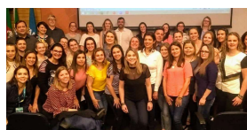
Imagem 1 – Encontro realizado em 10/10/19