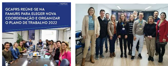
Imagens 3 e 4 – Escolha da Diretoria 2022 e reunião presencial no dia 16/08/22 na Sede da FAMURS.