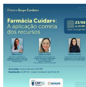
Imagem 2 – Card da Live realizada em 23/08/22