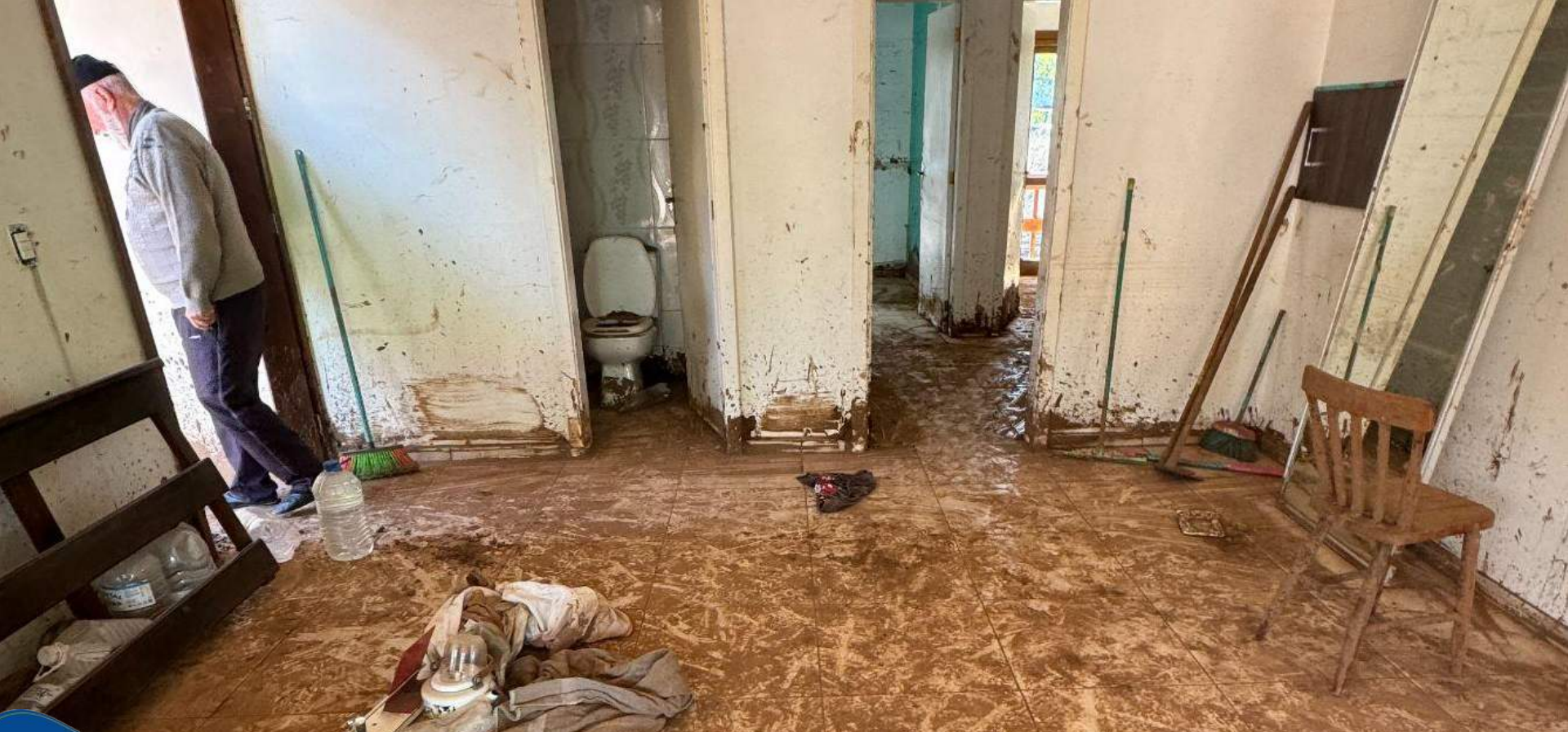
1.SINIMBU - Vale do Rio Pardo | 18 de maio