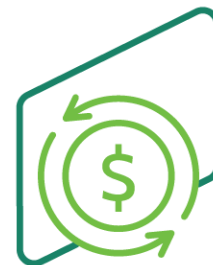
Capital de giro