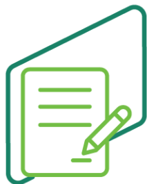
Prestação de garantia (fiança bancária)